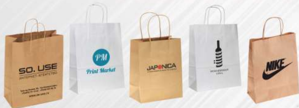
Крафт-Пакет 24*28*14 см. Цвет: белый.