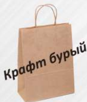
Крафт-Пакет 24*28*14 см. Цвет: бурый.